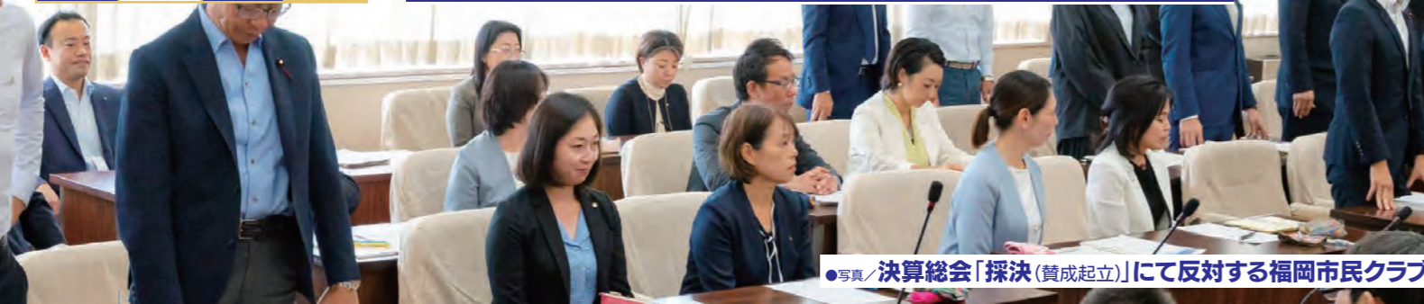
●写真/決算総会「採決(賛成起立)」にて反対する福岡市民クラブ